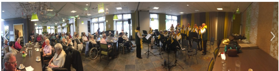
Tekst en foto: Ad Brouwers

of bellen met: - Jan Vogels 06 8335 7296 - Ad Brouwers 06 2501 5335