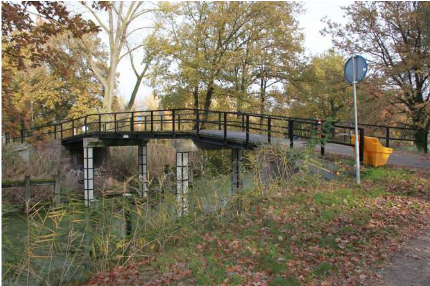
De kattenrugbrug aan de Oudvensestraat

De boten die vroeger door het kanaal kwamen hadden geen motor en moesten door menselijke of dierlijke krachten worden getrokken. Schippers die over een paard konden beschikken gebruikten dat hiervoor. Schippers die dat niet hadden konden alleen maar mankracht inzetten. Dat was vaak moeder de vrouw met de kinderen. De bruggen die gepasseerd moesten worden zorgden voor een fiks probleem want het was een heel karwei om het trektouw voorbij de zo genoemde kattenrugbruggen te krijgen. Om die reden zijn er bij de meeste