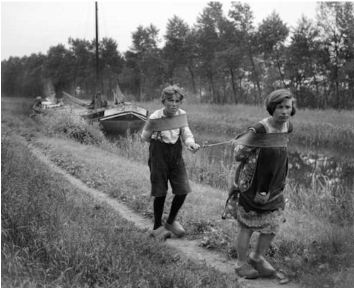
Deze foto dateert uit 1931 en laat het z.g. scheepsjagen zien

Voor diegenen die dat niet weten: het Eindhovens kanaal loopt vanuit het centrum van Eindhoven via Geldrop en Mierlo tot aan de Zuid Willemsvaart. Rinie Weijts: "Het kanaal is met de hand gegraven, natuurlijk gebruikmakend van een schop. Het karwei, dat in 1842 begon, heeft ongeveer drie jaar geduurd." ⇒ ⇒